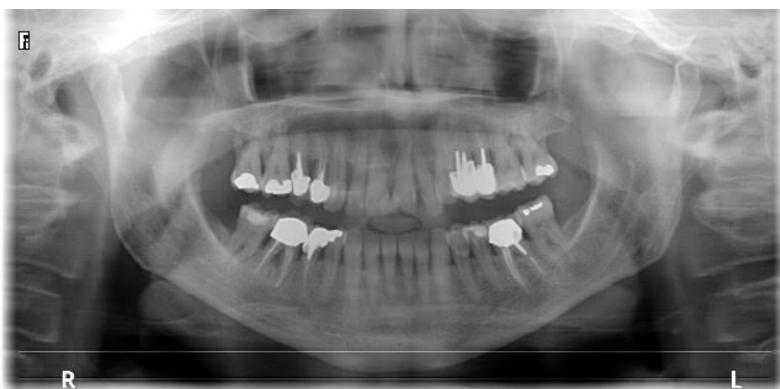
Radio panoramique post chirurgicale