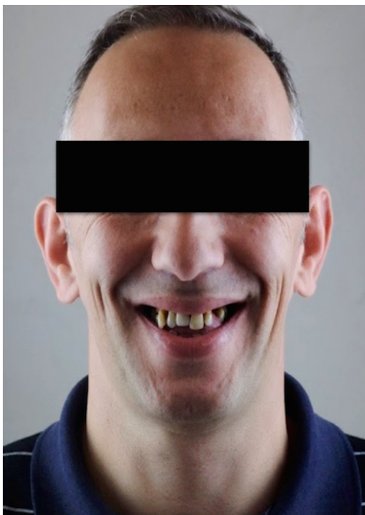
Photo post traitement