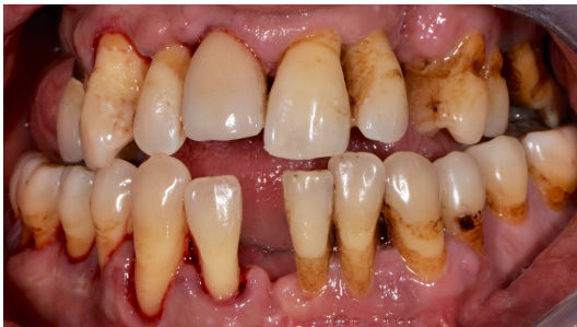
Photos pré traitement